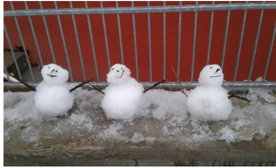
Nuestros muñecos de nieve.