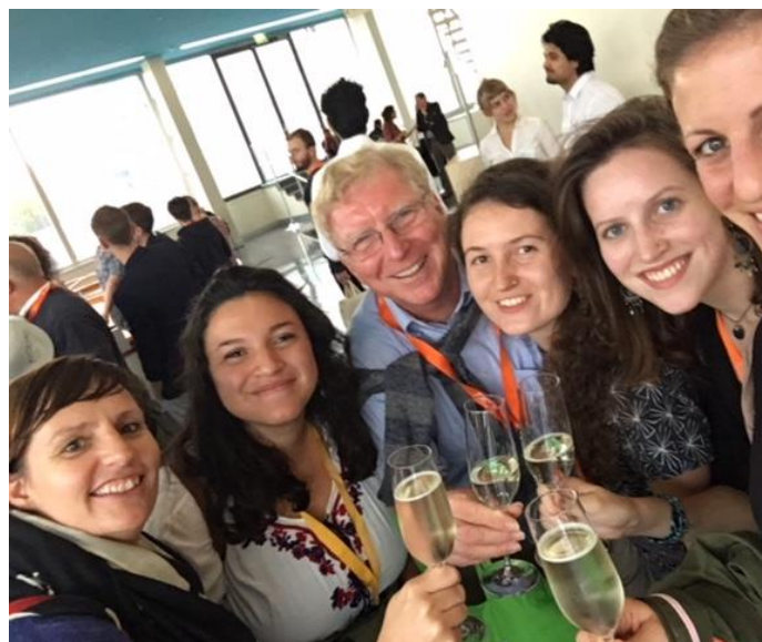
15. September 2018 bei der Jubiläumsfeier in Berlin: Prosit auf 10 Jahre erfolgreiche Freiwilligendienste