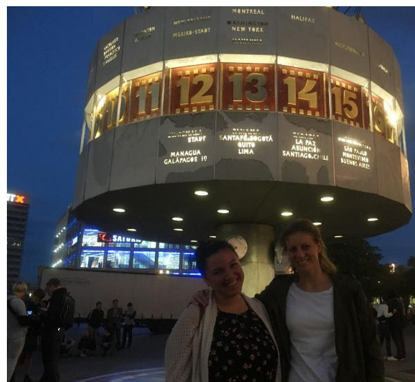
Berlin Alexanderplatz: In Quito ist es 13Uhr