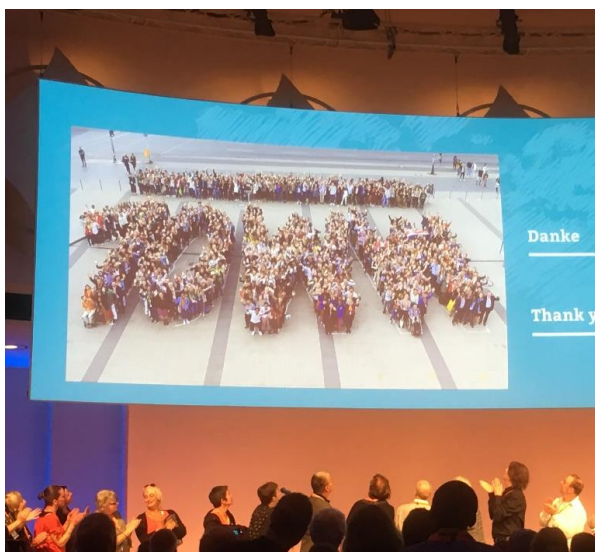
Die Teilnehmer am Jubiläumsfest beim Flashmob