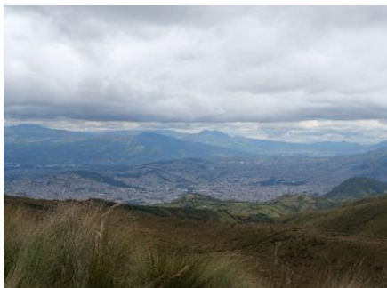
Vista en el Rucu Pichincha