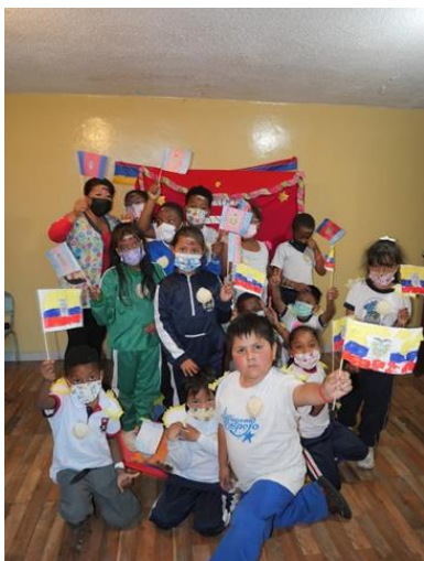
En el mes de civismo

Y luego están las actividades de los viernes. Siempre tratamos un valor y lo trabajamos de diferentes maneras con manualidades, juegos, juegos de rol y mucho más. Me gustan especialmente estas actividades porque todo el mundo se divierte mucho y siempre están muy bien diseñadas. En octubre, el tema fue "Civismo", así que hice de turista y los niños me ayudaron a conocer un poco más Ecuador. Les entusiasmó y probablemente aprendieron un poco ellos mismos. En general, me gusta mucho mi trabajo porque me llevo bien con los profesores y me gusta mucho trabajar con los niños.