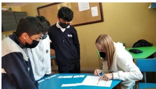
Curso de ingles

Y luego están las actividades de los viernes. Siempre tratamos un valor y lo trabajamos de diferentes maneras con manualidades, juegos, juegos de rol y mucho más. Me gustan especialmente estas actividades porque todo el mundo se divierte mucho y siempre están muy bien diseñadas. En octubre, el tema fue "Civismo", así que hice de turista y los niños me ayudaron a conocer un poco más Ecuador. Les entusiasmó y probablemente aprendieron un poco ellos mismos. En general, me gusta mucho mi trabajo porque me llevo bien con los profesores y me gusta mucho trabajar con los niños.