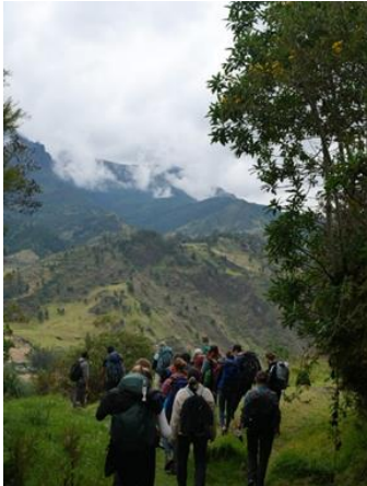
En la camina

Después de no salir de Quito en septiembre, me reuní con un grupo de voluntari@s de todo Ecuador en octubre y recorrimos el “Quilotoa Loop”. Una caminata de tres días que termina con el lago de cresta Quilotoa. La naturaleza era hermosa y, aunque fuera agotador el trayecto, siempre te recompensaba con una buena vista. Por supuesto, el agua azul profundo del lago Quilotoa era especialmente hermosa. ¡Me demuestra una vez más lo hermoso que es Ecuador y lo mucho que me queda por visitar! Además, el grupo de voluntarios era totalmente amistoso y me gustó mucho conocer gente nueva. Espero poder visitar uno o dos de ellos en las próximas semanas.