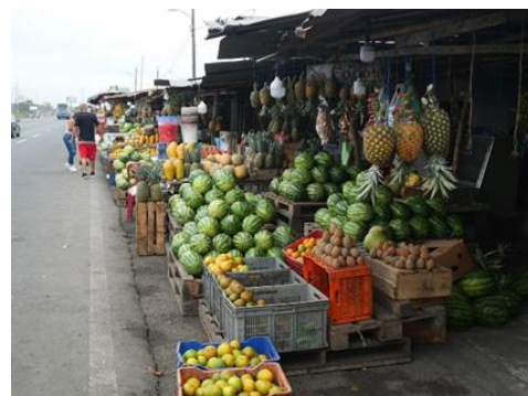
Cerca de Guayaquil