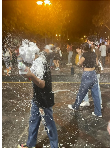
Carnaval en el centro de Cuenca con Cariocas