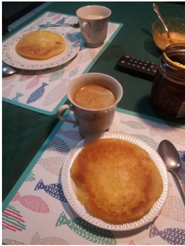
Tomar cafe con tortilla de coclo, con mi madre anfitriona