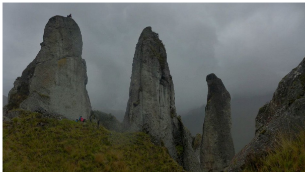
Escalar en el Cajas

Paseo al Cotopaxi en el seminario intermedio: