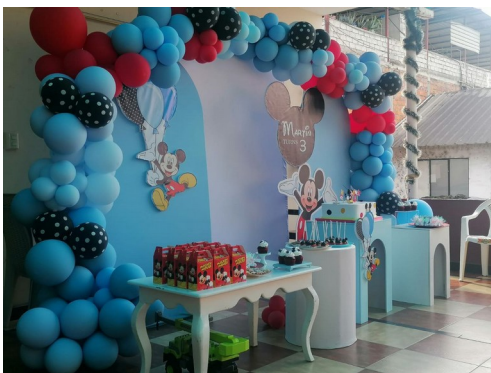
Decoracion del cumpleaños