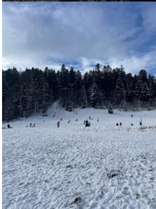
Deslizamiento en trineo, Hinterzarten.