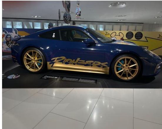
Entrada al Porsche Museum. Algunos autos que vi en el Porsche Museum