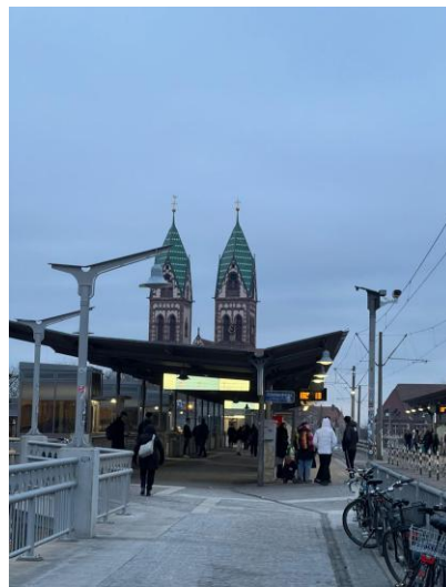
Freiburg, estación central.