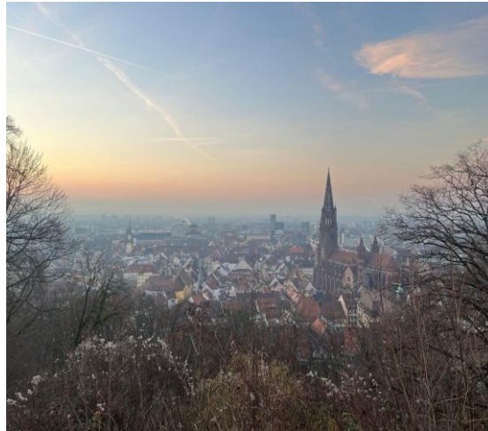
Freiburg im Breisgau, vista desde Schlossberg.